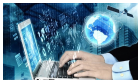
VOUCHER DIGITALIZZAZIONE IN ARRIVO 240 MILIONI DI EURO

Sono in arrivo altri 240 milioni di euro per finanziare i voucher digitalizzazione, che vanno ad aggiungersi ai 100 milioni di euro già presenti. Il decreto che aumenta le risorse è al vaglio della Corte dei Conti.